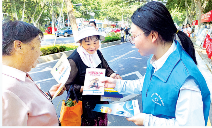
“要时刻保持警惕。” “上边的案例一定要细看。”