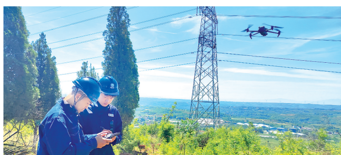
隐患点进行排查。