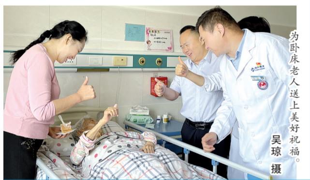
为卧床老人送上美好祝福。

此次联谊活动不仅让护士和老人们感受到了来自社会的关爱,也进一步拉近了金融机构与社区群众之间的距离。中原银行三门峡分行相关负责人表示,未来将持续深化与老年护理院的温情联动,坚守金融为民初心,传递公益温度,用心用情为老年群体提供更加贴心的金融服务。