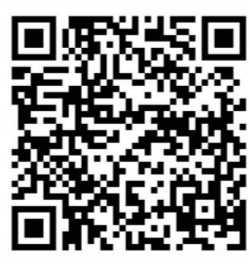
扫码收听 经典一刻

手，在墙上敲了三下回应。那边又敲了三下。他兴奋得浑身发抖，像溺水的人抓住了一根绳子。从那天起，他每天与那位素未谋面的法利安神父交流，学会了数学、历史、哲学、四五种语言，也学会了耐心与计算。他的眼睛不再空洞，他的脊背挺直了，他发现：黑暗并没有吞噬他，反而锻造了他。他知道，总有一天，他会离开这个地方。而那一天到来时，他不会只是一个逃犯——他将是上帝或魔鬼在人间的化身。