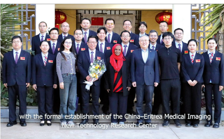
厄立特里亚卫生部部长阿来娜女士到医疗队驻地看望中国医疗队员

在农历除夕这个万家团圆的特殊时刻，远在非洲之角的厄立特里亚，一股温暖的中国力量通过电波传遍红海之滨。