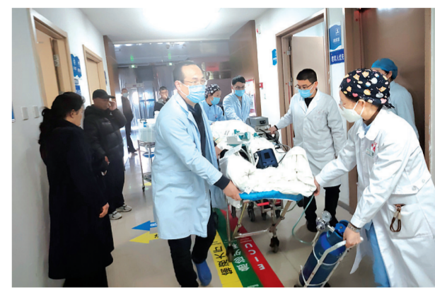
ECMO团队紧急转运患者过程中

新春佳节，万家团圆、年味正浓，当人们沉浸在辞旧迎新的喜悦之中，黄河三门峡医院南院区急危重症医学科的医护人员，始终坚守在守护人民群众生命健康的第一线。