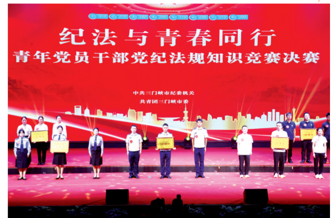
参加全市青年党员干部党纪法规知识竞赛