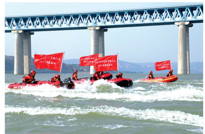
开展水域救援演练