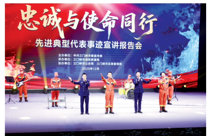
先进典型代表事迹宣讲报告会