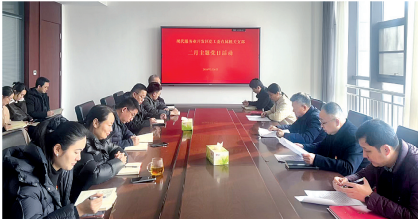
主题党日活动现场

本报讯 2月6日，三门峡现代服务业开发区党工委直属机关党支部召开二月主题党日活动。