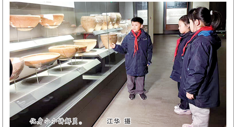
化身小小讲解员。

近日,老师带我们去参观庙底沟博物馆,在那里我见到了许多精美的纹饰,其中月牙纹、人面纹和花瓣纹最让我印象深刻。我还看到了许多承载着千年历史的文物,它们是我们三门峡的骄傲!我最喜欢花瓣纹,它是馆中最经典的纹饰之一,蕴含着古人的智慧。老师说庙底沟博物馆是一个充满历史知识的地方,我以后想来这里欣赏文物,了解更多家乡的文化,长大后更好地建设家乡。(辅导教师:吕江华)