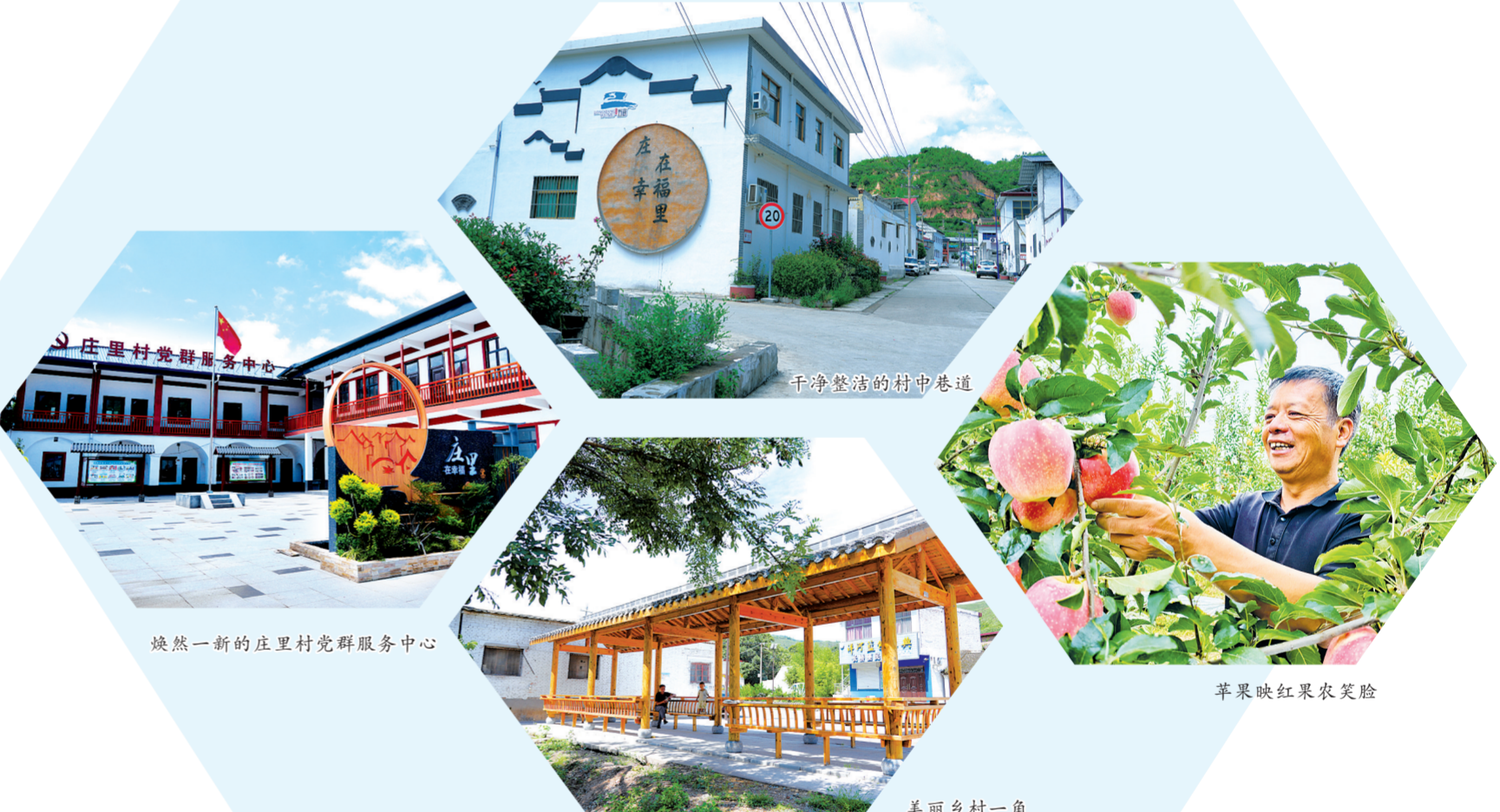
干净整洁的村中巷道

牧生猪养殖、东方希望生猪繁育等项目，推动畜牧业规模化、产业化发展；通过党支部领办专业合作社30个，带动4000余户农户发展特色种植、养殖，户均增收万元以上。 项目建设的落地生根，为经济发展注入了强劲动能。五年来，该乡累计引资30.76亿元，一批重点项目相继建成投产：2021年，总投资3亿元的灵宝高新国际学校落地建成，成为豫晋陕黄河金三角地区的优质教育品牌；2023年，总投资2083万元的高标准葡萄种植园建成，提供就业岗位200余个，群众年增收2万元以上；2024年，总投资2.3亿元的新能源商用车交通服务项目建成运营，日可转运货物6100吨；2025年，投资2.8亿元的乔原水库项目完成备案，镇区环境提升、给排水等4个项目完成可研报告编制，其中三八桥至走马岭村道路提升项目进入省级项目库。 营商环境的持续优化，更让企业发展信心倍增。该乡推进“放管服”改革，在政务服务大厅设立“企业服务专窗”，实行“一窗受理、全程代办”，将审批时限平均压缩30%。建立“企业走访日”制度，每月组织工作人员深入企业开展政策宣讲、技术指导，五年来累计解决企业用工短缺、原材料采购、用电用水等问题15件，帮助35家小微企业获得小额贷款100余万元。