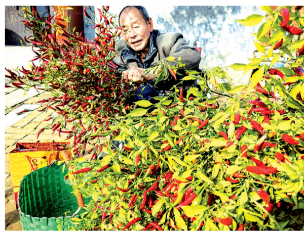
近日，池洛乡仰韶镇阳光村群众趁着晴好天气摘辣椒，大家边干活边拉家常，红红的辣椒为冬日增添了一抹温暖的色彩。

值班值守到位。该县严格落实领导干部带班制度、关键岗位24小时值班和紧急信息审核报送制度，确保信息畅通、指令畅达，确保遇到突发状况时能够及时有效处置，保障人民群众生命财产安全。(常帮娃)