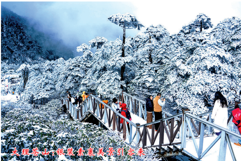
11月24日，云南大理苍山冰雪景观吸引众多游客前来观赏。受冷空气影响，云南大理苍山迎来2025年入冬后的首场降雪。银装素裹的山林与山脚下的洱海、古城相映成趣，构成一幅水墨画卷。

欧盟轮值主席国丹麦财政大臣兼2026年欧盟预算首席谈判代表尼古拉·瓦门说，2026年预算聚焦国防、移民、竞争力等优先领域，以“果断回应欧洲公民的需求”。与此同时，预算也