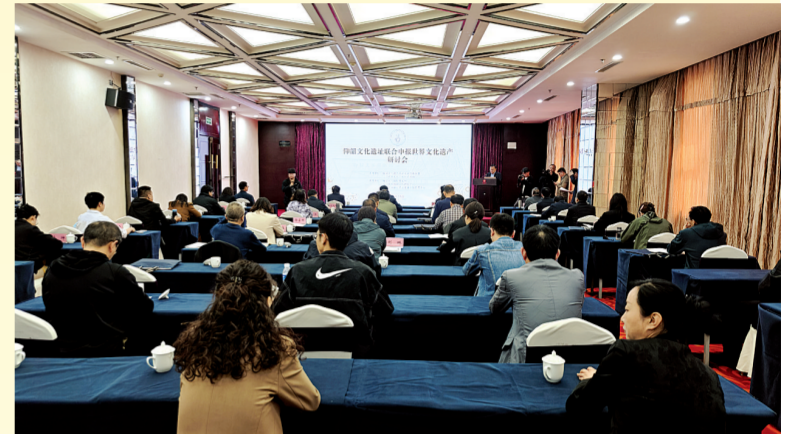
仰韶文化遗址联合申报世界文化遗产研讨会现场。