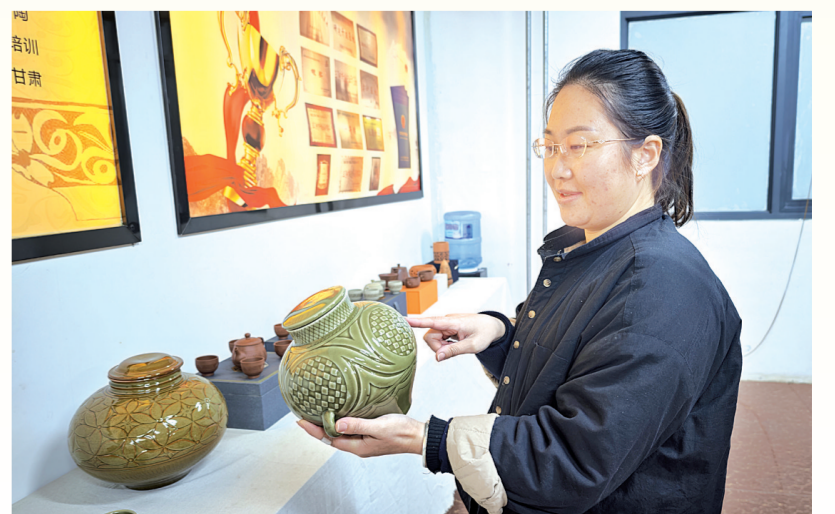
新研发出的含有仰韶文化元素的酒坛文创产品。