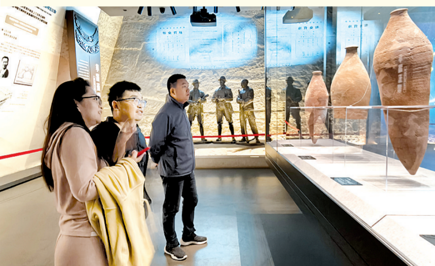
参加第八届全国青年考古论坛的学者们在仰韶文化博物馆参观,沉浸式感受仰韶文化魅力。