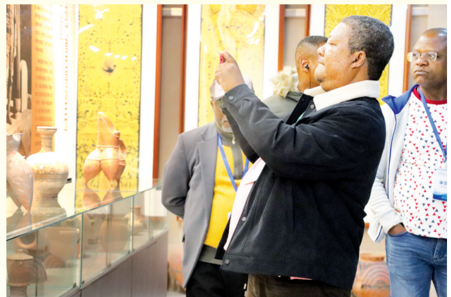
葡语国家知名记者研修班成员探秘仰韶文化博物馆。