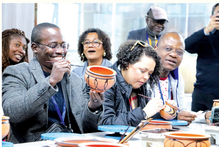
葡语国家知名记者研修班成员体验彩绘。