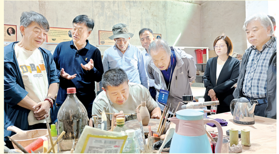
纪念班村遗址多学科综合发掘与研究项目35周年活动中,专家学者在渑池县南村乡参观彩陶复原工艺。

既有珠玉在前,渑池县必将再接再厉,让成功和圆满成为此次研讨会的鲜明底色。相信这场盛会不仅能进一步引起社会各界的广泛关注,涵养更浓厚的文化氛围,产生积极深远的影响,更能让仰韶文化在新时代绽放璀璨的光芒,迈向更广阔的天地。