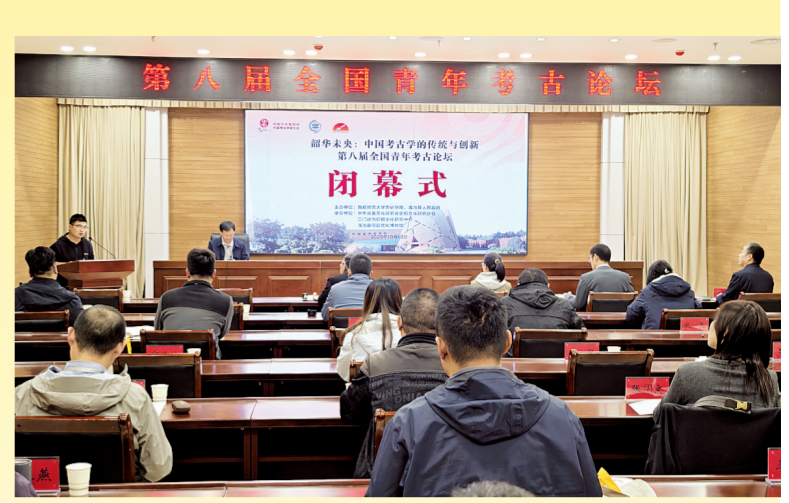
第八届全国青年考古论坛现场。