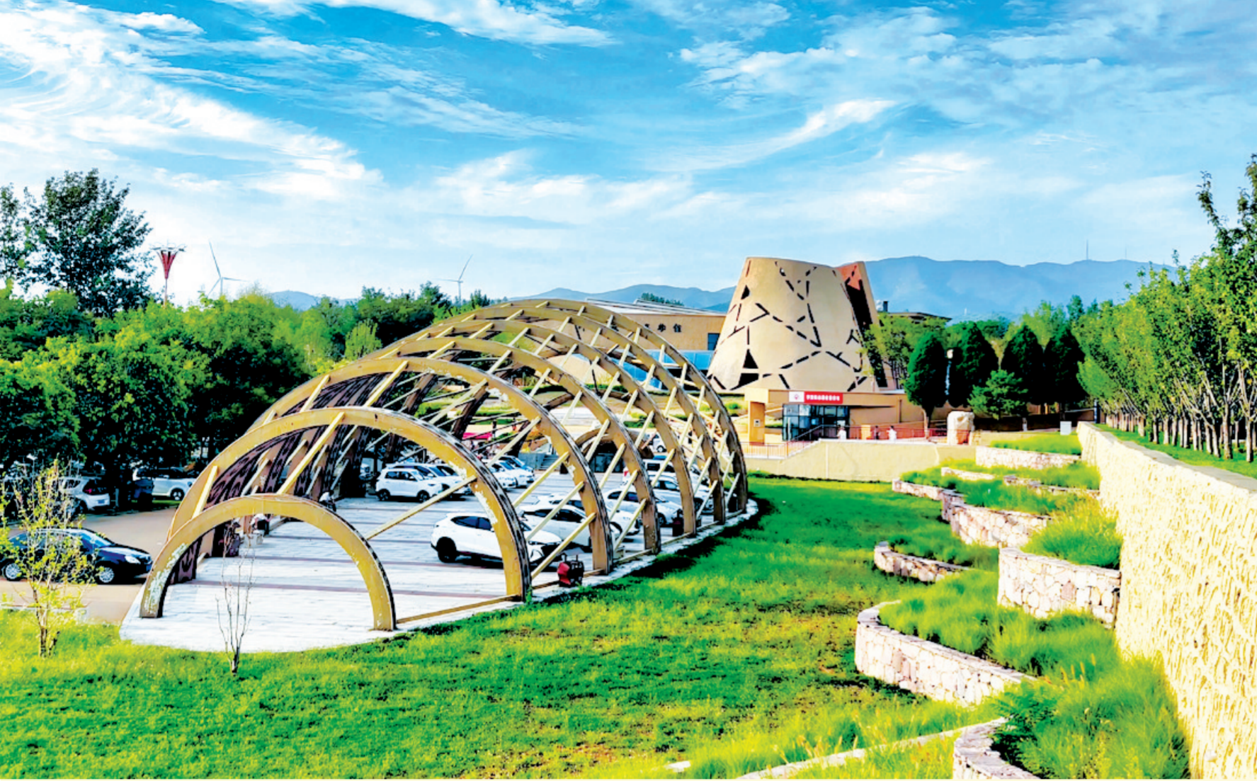
仰韶村国家考古遗址公园一角。