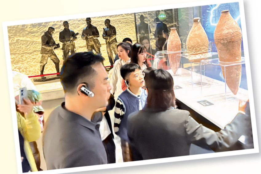
仰韶文化博物馆内，游客正在认真听讲解。

国庆、中秋“双节”假期虽已落幕，但三门峡的诗意画卷仍在徐徐舒展。这座浸润着历史韵味与时代活力的城市，正期待着与更多人在下一个转角邂逅，继续书写文旅交融的美好故事。