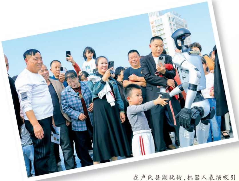
在卢氏县潮玩街，机器人表演吸引游客互动。