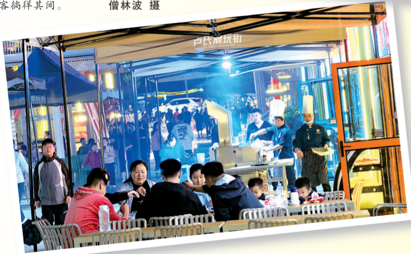
卢氏县潮玩街夜市热闹非凡，人们品特色美食，感受浓浓“烟火气”。