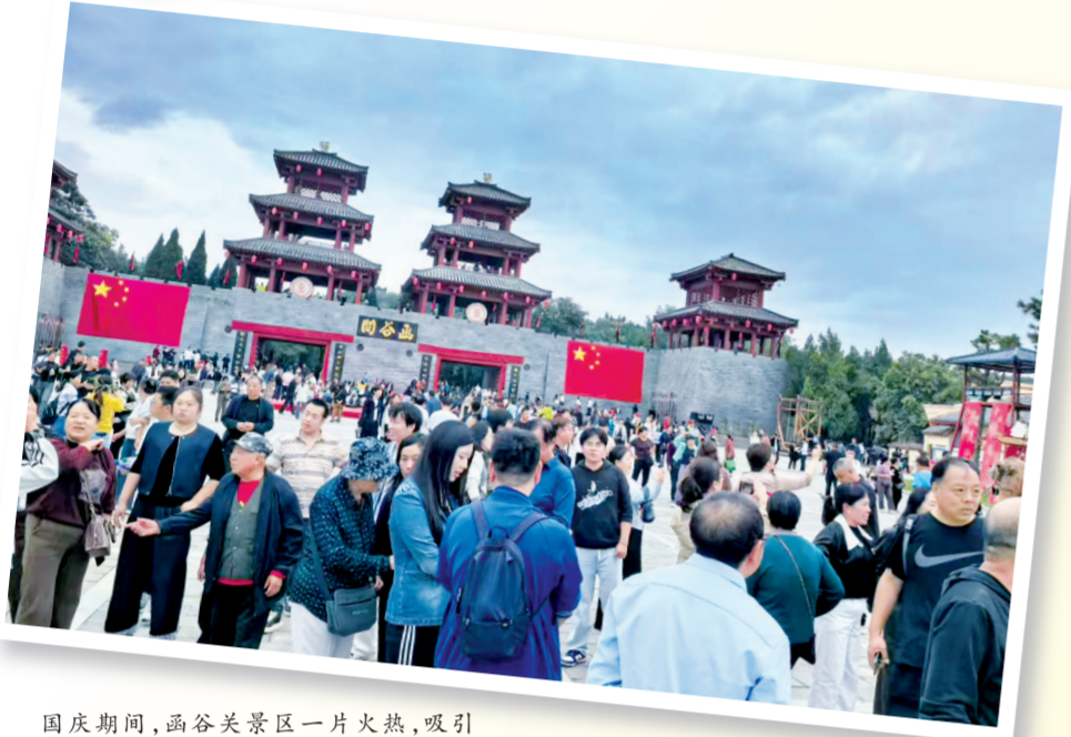
国庆期间，函谷关景区一片火热，吸引大批游客徜徉其间。