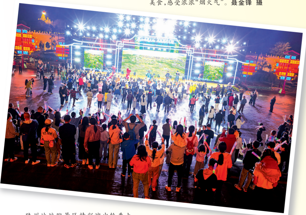
陕州地坑院景区精彩演出轮番上演，为游客送上节日文化盛宴。