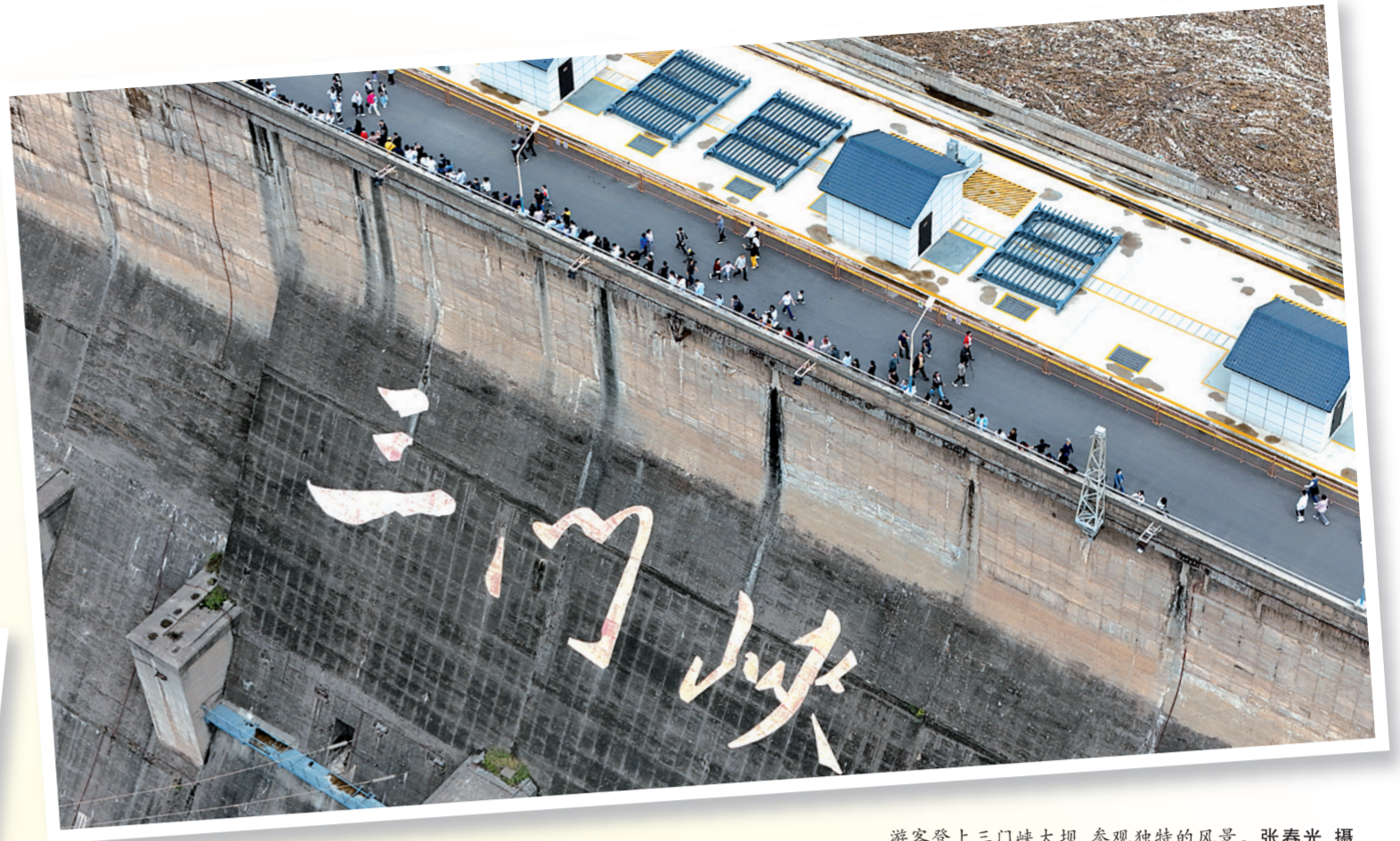
游客登上三门峡大坝，参观独特的风景。