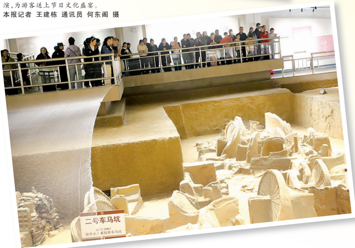
虢国博物馆内，参观者静静俯瞰着坑内的车轮与车辙遗迹。