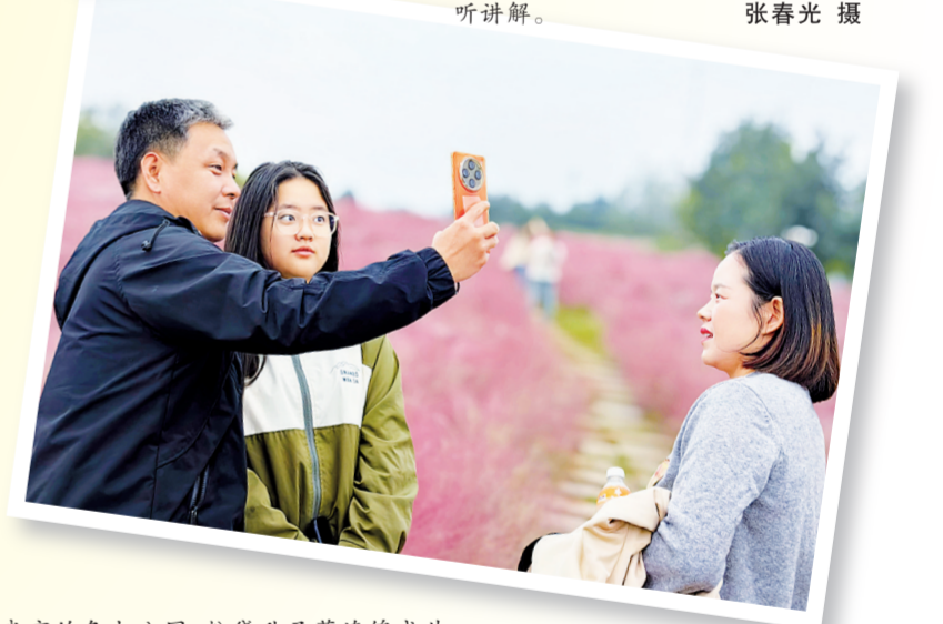
在市的各大公园，粉黛乱子草连绵成片，行走其间，仿佛被粉色云海包围。