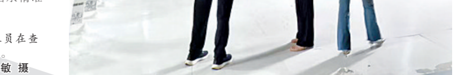
银行工作人员在查看企业运营情况。