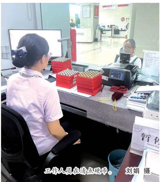
工作人员在清点硬币。

“这些散落的硬币承载着普通人真实的生活点滴,每一次清点,不仅是在数钱,更是在传递服务的温度。”该营业部相关负责人表示。