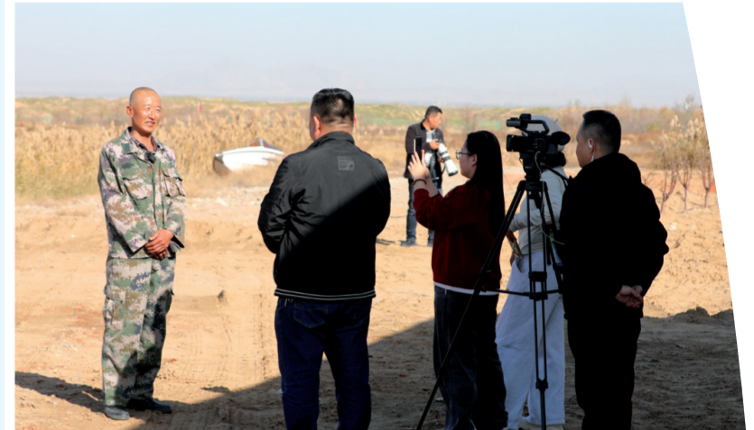
↑在内蒙古巴彦淖尔市乌梁素海湿地水禽自治区级自然保护区,三门峡追踪团队媒体记者正在采访当地大天鹅保护的经验和做法。