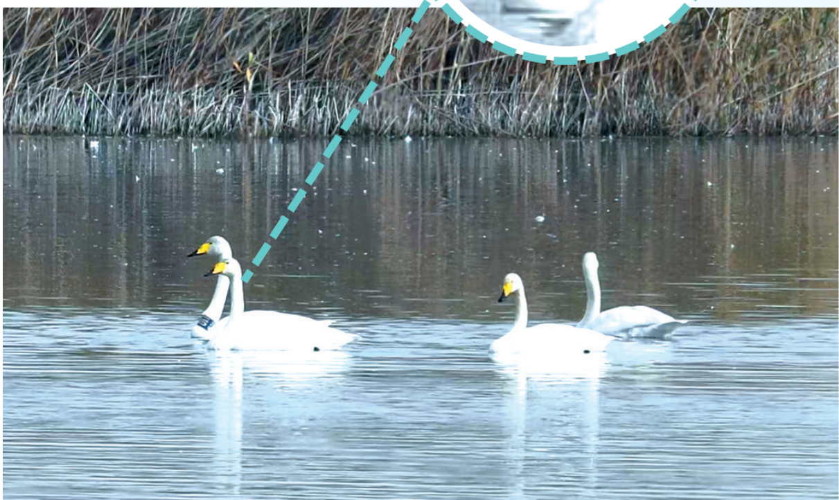
在内蒙古巴彦淖尔市磴口县沙套套海苏木的包勒浩特嘎查,三门峡环志大天鹅110号和它的同伴正在觅食休息。