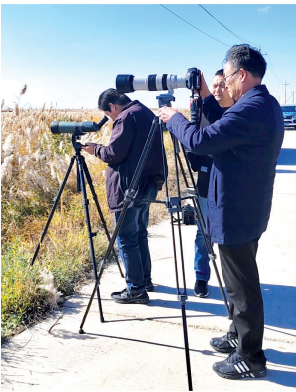
↑在内蒙古巴彦淖尔市牧羊海湿地公园,三门峡追踪团队正在通过望远镜观察环志大天鹅328号的情况。