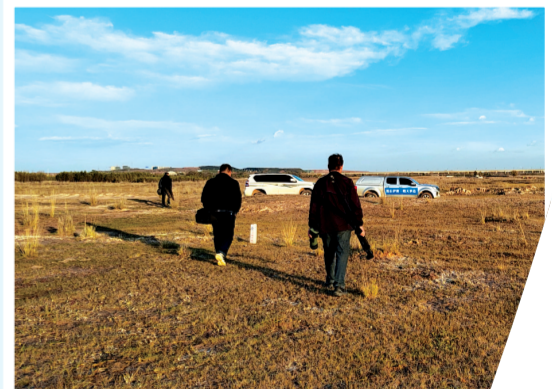
←在内蒙古鄂尔多斯市西海子湿地,追踪团队正准备前往下一个湿地观测点寻找更多迁徙大天鹅的踪迹。