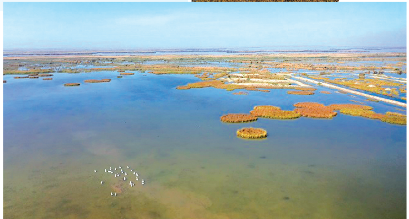
内蒙古巴彦淖尔市牧羊海湿地公园水域辽阔、水草丰茂、水质清澈,是大天鹅迁徙途中重要的停歇地之一。