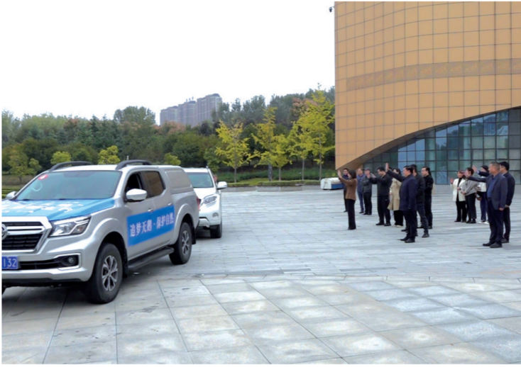
←在三门峡黄河湿地保护中心,三门峡追踪团队一行前往内蒙古。