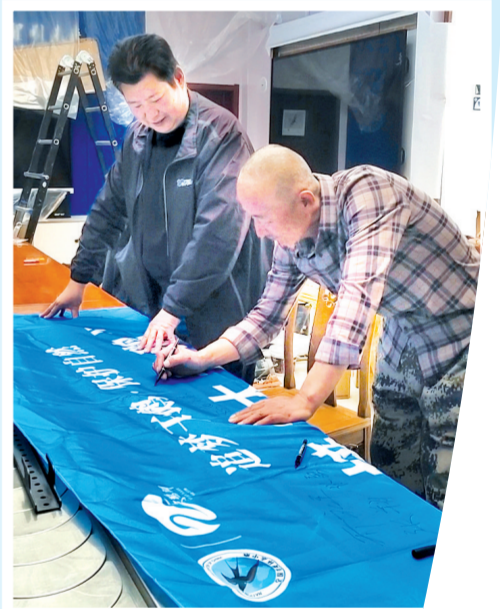
→在内蒙古巴彦淖尔市乌梁素海湿地水禽自然保护区管理站,当地工作人员正在“接大天鹅回家”队旗上签名。