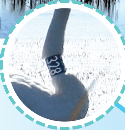
↑在内蒙古巴彦淖尔市牧羊海湿地公园,我市环志大天鹅328号正在迁徙途中休息停留。