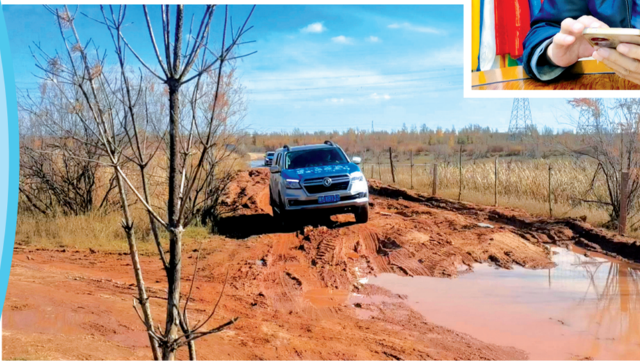
↑浅滩湿地是最适宜大天鹅停留休息的地方。为了寻找迁徙大天鹅的踪迹,追踪团队经常需要在湿地周边驾车行驶。

万物各得其所,各得其养以成。让我们携手努力,共同守护这片美丽的家园,让候鸟的迁徙之路更加安全顺畅,让生态画卷更加绚丽多彩。