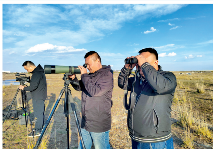
↑在内蒙古鄂尔多斯市西海子湿地,追踪团队正在观察记录大天鹅的情况。