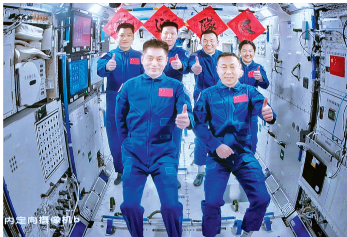
十月三十日在北京航天飞行控制中心拍摄的神舟十九号航天员乘组"全家福"。

后续,两个航天员乘组将在空间站内进行在轨轮换。其间,6名航天员将共同在空间站工作生活约5天时间,完成各项既定工作。