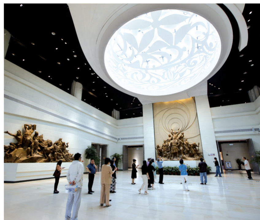
参观庙底沟博物馆,感受中华文明