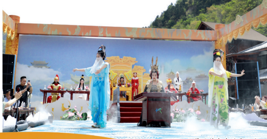
仙门山景区特色表演聚人气