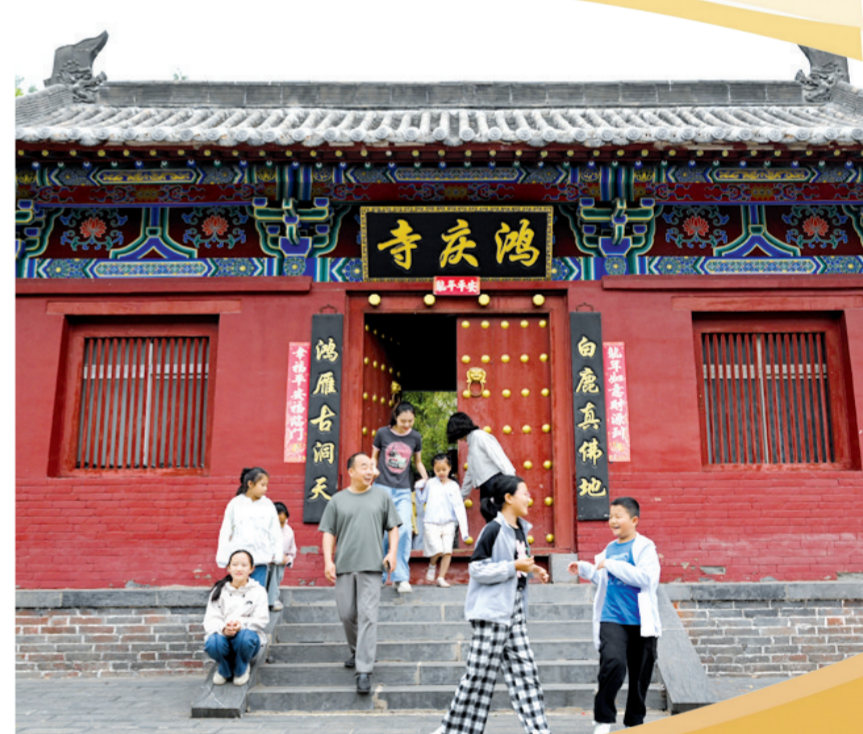
鸿庆寺人气十足