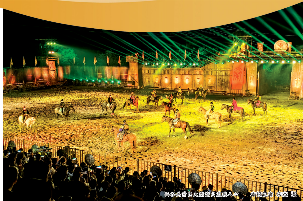
函谷关景区大型演出震撼人心