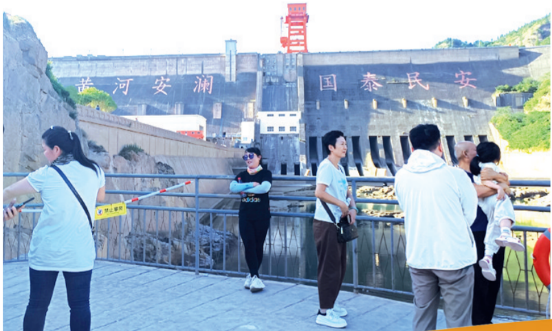
外地游客游览黄河三门峡大坝