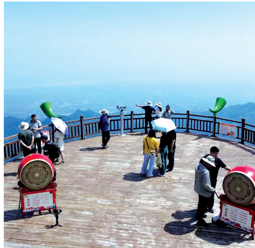
登上汉山来“喊山”