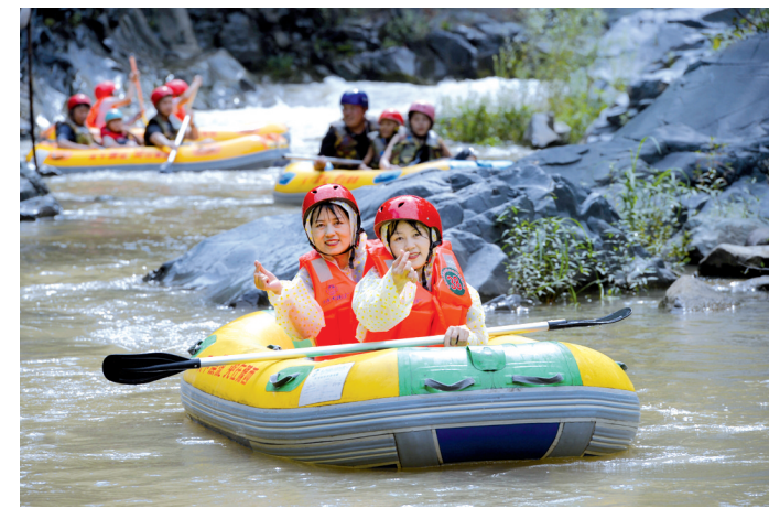
双胞胎们在大峡谷激情漂流

豫西大峡谷景区相关负责人表示，豫西大峡谷将继续秉承“以人为本、服务至上”的理念，不断提升服务质量和管理水平，加强与其他景区的合作与交流，将豫西大峡谷打造成为更加美丽、更加繁荣的旅游胜地，期待更多的游客步入卢氏，领略豫西大峡谷的清逸与秀美，感受大自然的鬼斧神工。