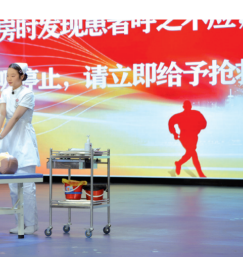
三门峡市卫生学校护理专业学生进行心肺复苏技能展示。

卢氏县中等专业学校烹饪专业教师夏光富与学生一起制作雕花作品——金龙出海。该作品参加2023年河南省暨许昌市职教宣传周活动展出,深受好评。