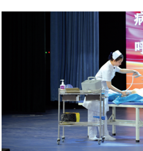
三门峡市卫生学校护理专业学生进行心肺复苏技能展示。

卢氏县中等专业学校烹饪专业教师夏光富与学生一起制作雕花作品——金龙出海。该作品参加2023年河南省暨许昌市职教宣传周活动展出,深受好评。