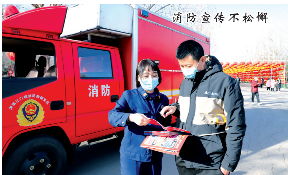
春节期间,渑池县“品味仰韶 陶醉渑池”2023年新春游园灯会在会盟生态园举办。为切实加强消防安全工作,渑池县消防救援大队深入灯会现场积极开展消防安全宣传。图为工作人员向群众发放消防宣传彩页时的场景。