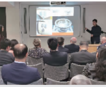
杨拴朝在英国剑桥大学演讲