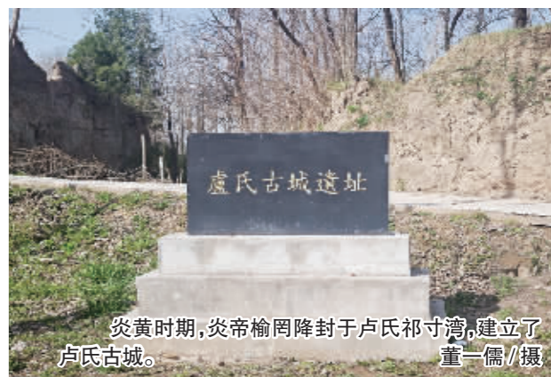
炎黄时期，炎帝榆罔降封于卢氏祁寸湾，建立了卢氏古城。