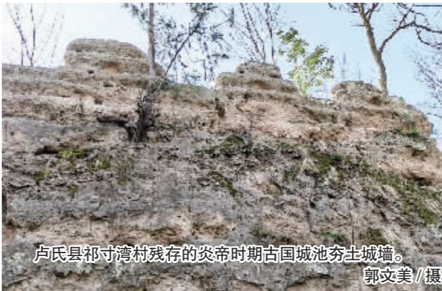
卢氏县祁寸湾村残存的炎帝时期古国城池夯土城墙。

遗迹遍布，印证医事活动传承。卢氏境内现存扁鹊祠、扁鹊山、扁鹊井、卢医祖庙遗址等20余处与扁鹊相关的历史遗迹，构成了扁鹊文化的物质空间网络。位于卢氏县文峪乡伏虎山腰的扁鹊洞，在清光绪版《卢氏县志·古迹寺庙篇》中有明确记载，今仍依稀可见“五运六气图”石刻残迹，印证其“观天象、察地理”的医学思想。卢氏县东明镇祁寸湾村古城墙以东的丛林中，青岩石覆盖的扁鹊井被悉心保护，扁鹊井药泉喷涌消疫救灾的故事为当地村民世代相传。位于卢氏古城东街的“卢医