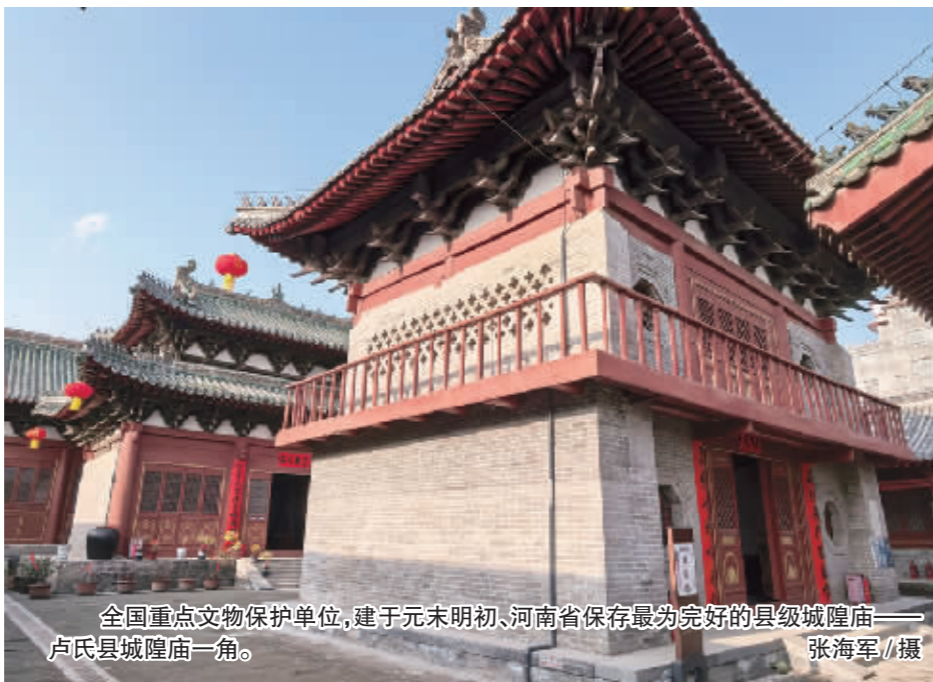
全国重点文物保护单位，建于元末明初、河南省保存最为完好的县级城隍庙——卢氏县城隍庙一角。

卢氏县地处河南西部，横跨长江、黄河两大流域，是河南省面积最大的县。县城位于秦岭东端余脉崤山、熊耳山、伏牛山的簇拥之中，洛河穿城而过。清光绪版《卢氏县志》以县令郭光澍“城高池深，山川明秀，众多大邑！城踞万山之内，四面层峦叠嶂、冈岭如环，一川洛水缭绕云中，来无端而去无边，风景犹是”的生动笔触，描绘出这片土地上山水交融的壮美图景。这不仅 是地理风貌的写照，更隐喻着其作为文明交汇要地的历史地位。尤为重要的是，卢氏县不仅是全国唯一有化石实物可考的“人猿相揖别”之地，更以其完整连续的文化序列，成为探索中华文明起源不可或缺的关键地区。从距今约4000万年的“卢氏耐猴”——国内发现年代最久远的原始灵长类动物化石，到上世纪八十年代以来不断发现的恐龙蛋化石群，再到距今约十万年前的“卢氏智人”头骨化石，这些重大发现串联起从远古哺乳动物到人类出现的相对清晰的演化链条。同时，境内分布的63处古文化遗址与22处古生物化石点，裴李岗文化、仰韶文化、龙山文化等史前遗址层层叠压、脉络清晰，确证本地文明起源至少可上溯至五千年以前。洛河卢氏全境蜿蜒113公里，如同一条文化纽带，将卢氏与千年古都洛阳紧密相连，使其天然成为“河洛文化”的中心区域。 卢氏县近年来自觉融入中华文明探源工程，依托得天独厚的文物资源与科学严谨的学术考证，系统梳理并实证了“战国置县”“卢姓祖地”“扁鹊故里”三大核心文化标识，构筑起支撑县域发展的深层精神内核，实现了从文化自觉到发展自信的跨越，为宏观层面的中华文明起源叙事提供了扎实、鲜活而富有说服力的基层样本。