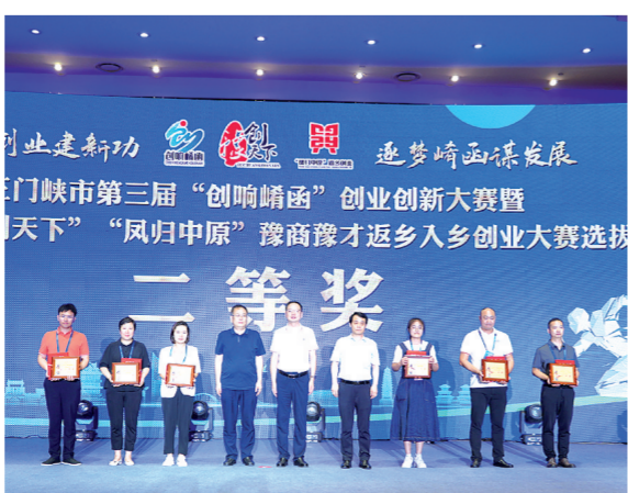
为二等奖获得者颁奖