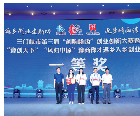
为一等奖获得者颁奖