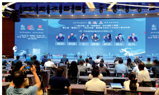
专家现场大屏打分