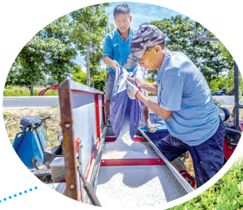
为玉米播种机加装化肥