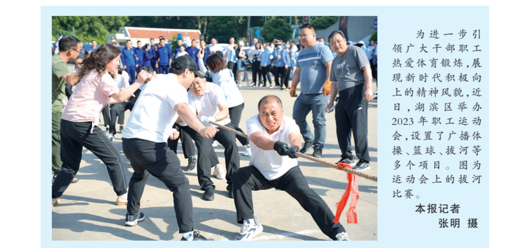
为进一步引领广大干部职工热爱体育锻炼，展现新时代积极向上的精神风貌，近日，湖滨区举办2023年职工运动会，设置了广播体操、篮球、拔河等多个项目。图为运动会上的拔河比赛。本报记者 张明 摄

本报讯 今年以来，灵宝市苏村乡纪委以廉政谈话为抓手，以推动作风提升为目标，常态化对各部门负责人及村党支部书记开展廉政谈话工作，做到把纪律“说”在前面，把警钟“敲”在前面，提前打好“预防针”。 紧盯重点工作，强化纪律约束。该乡纪委围绕各项重点工作，严格落实责任，相继对各部门负责人及村党支部书记进行谈话提醒，截至目前开展谈心谈话18人次，督促党员干部拧紧思想“螺丝”，上紧认识“发条”。 坚持关口前移，做到防患于未然。为避免监督空泛，谈话内容因人施策。围绕落实乡党委重点工作和“三资”管理等工作，共约谈部门负责人2人、村党支部书记6人。 抓好关键节点，融入日常监督。在重要节日节点，通过编发美篇、微信及廉洁短信等方式，督促引导党员干部谨防“节日病”，坚决杜绝“四风”反弹回潮。 (薛艳丽)