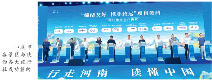
我市各景区与陕西各大旅行社成功签约