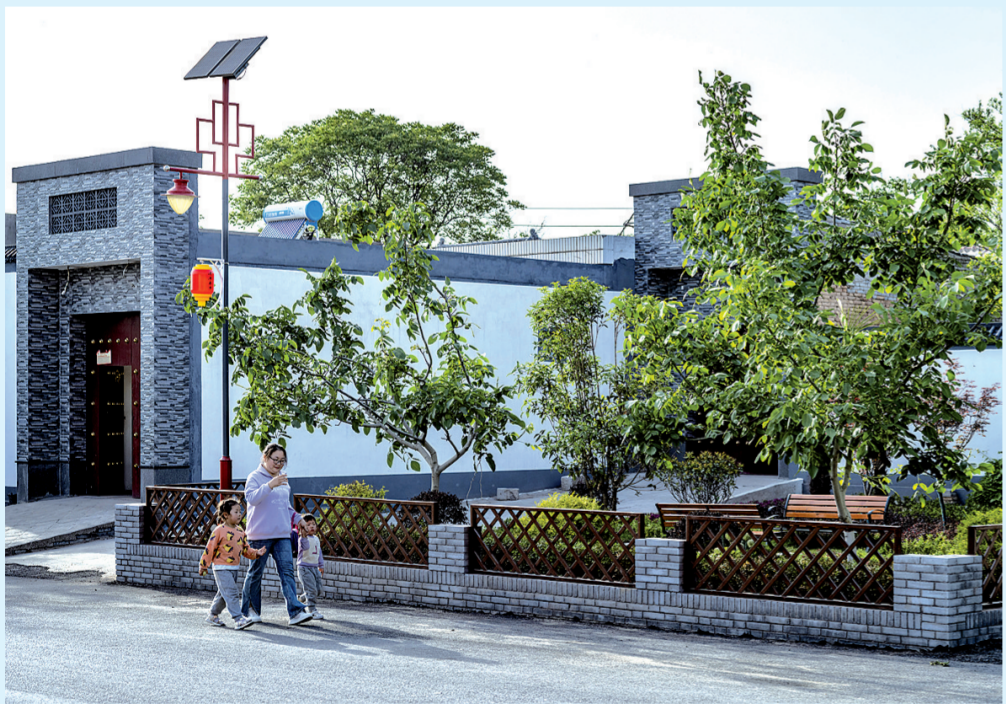
村里美了 群众乐了

缘。”席伟强说，在工作人员长期的矫正感化下，关心积极悔过自身，走出心理困境，重新融入社会，并在音乐道路上继续前行。 席伟强介绍，近年来，湖滨司法所从“心”出发，坚持严监管、重教育、多帮扶相结合的人性化管理，通过深层次的心灵沟通和关怀支持，以用心、耐心、贴心的“三心”工作方式换取社区矫正对象的真心，有效激发了社区矫正人员的改造动力。 “如果社区矫正对象能够勇敢地说出自己的故事，我们就应该让他们的努力和梦想被看见。”谈及歌曲创作的初衷，席伟强说，“深层次的情感关怀不仅是社区矫正工作中的重要一环，也体现着社区矫正工作的价值和意义。也希望这首能够鼓励、治愈更多处在低谷期的朋友们！”