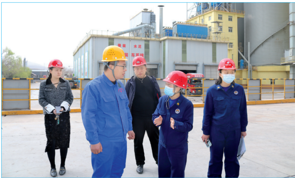
4月7日，陕州区消防救援大队宣传人员在河南锦荣水泥有限公司，提醒企业安全管理人员强化消防安全管理，发挥人防、物防、技防“三防”作用，为企业夯实消防安全“防火墙”。

今年以来，陕州区劳动保障监察大队在区纪委监委驻区人社局纪检监察组的指导下，始终坚持外树形象、内抓管理，进一步完善单位规章制度、规范执法流程，通过加强业务知识培训考核、转变工作作风，不断提升执法队伍整体素质，有力推动该局能力作风建设向纵深发展。