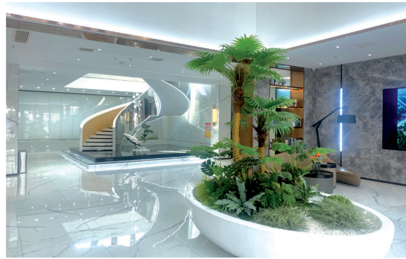
精装酒店式入户大堂

庭,落地玻璃设计,四周环绕水系、草坪、花卉和树木,让业主在健身之余尽享自然风光。“悦趣”——童梦乐园,以海洋为主题,以海龟为元素,设计有趣味廊架、儿童沙池、儿童跑道,让家长不出小区就可以与孩子共度美好亲子时光。 “合鑫拥有自己的物业公司,多年来,合鑫物业的周到服务得到了绝大多数业主的肯定与认可。”该项目销售人员说。三门峡合鑫物业服务有限公司组建于2014年,公司汇聚了一批物业管理优秀人才,打造了一支高素质、经验丰富的员工队伍。合鑫物业坚持“忠于事实,分享成果”的宗旨,以“解决物业难题,创造完美生活”为使命,以最大限度提升业主的居住幸福感为己任,以“星级标准 星级服务”为目标,创星级物业,建一流社区。7×24小时管家式服务、12小