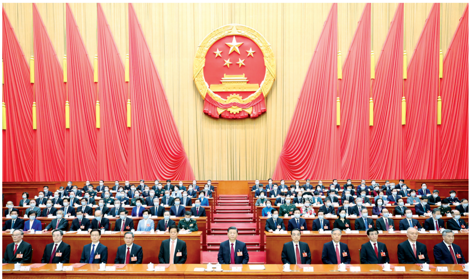
3月13日，第十四届全国人民代表大会第一次会议在北京人民大会堂闭幕。习近平等党和国家领导人在主席台就座。新华社记者 黄敬文 摄

新华社北京3月13日电 中华人民共和国第十四届全国人民代表大会第一次会议，在圆满完成各项议程，产生新一届国家机构组成人员后，13日上午在北京人民大会堂闭幕。